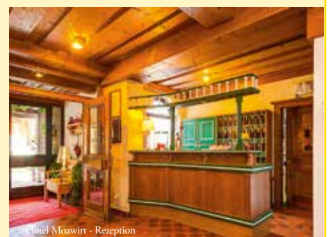
Hotel Moawirt - Rezeption