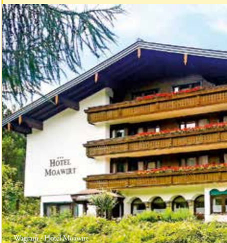
Wagrain - Hotel Moawirt

Mindestteilnehmerzahl: 25 Personen Deutsche Staatsangehörige benötigen einen gültigen Personalausweis. Bürger anderer Nationalitäten informieren sich bitte bei den zuständigen staatlichen Stellen.