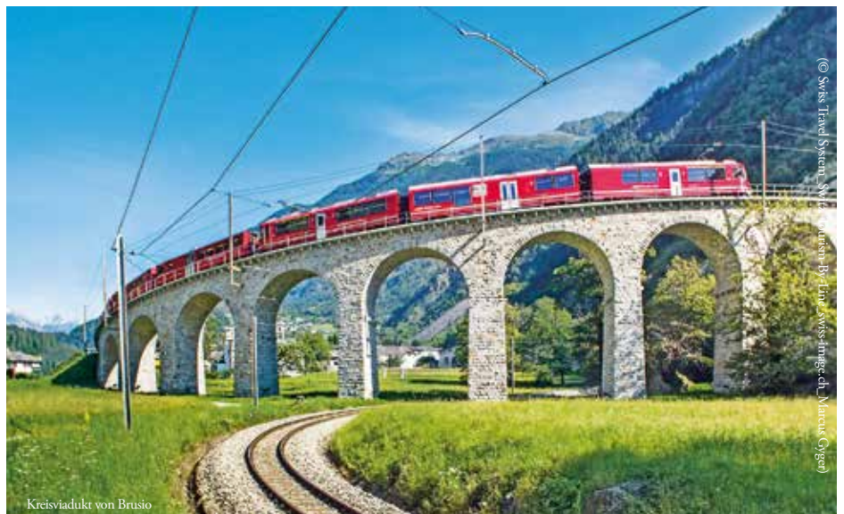
Kreisviadukt von Brusio