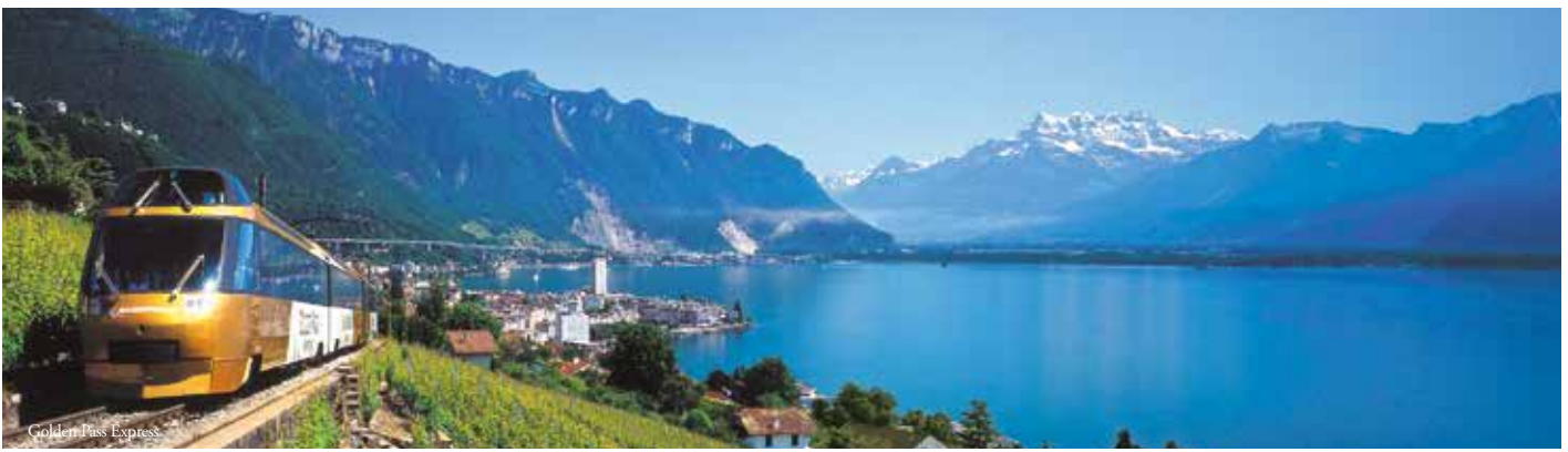
Golden Pass Express