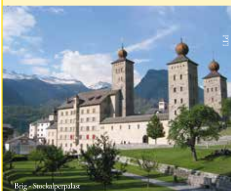
Brig - Stockalperpalast