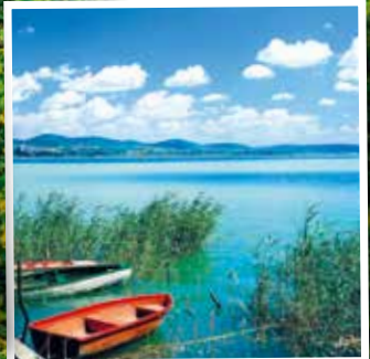
Naturidylle am Ufer des Plattensees

7-tägige Busreise mit Ungarn, Österreich & der Slowakei