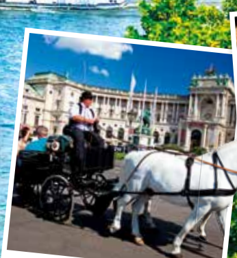
Kaiserliche Städte Wien, Budapest & Bratislava