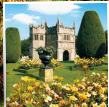
Mit Lanhydrock House!

8-tägige Busreise durch Südengland u. a. mit London, Stonehenge und Cornwall