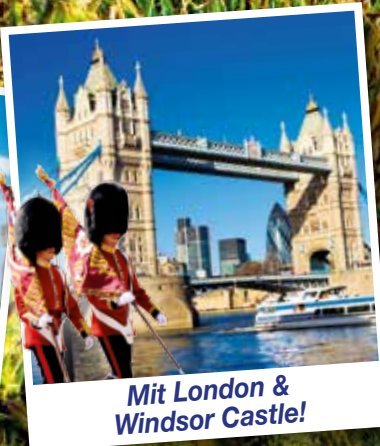
Mit London & Windsor Castle!